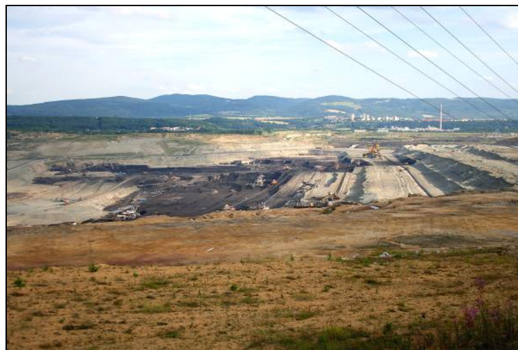
Pohled z Prezidentské vyhlídky na současnou sokolovskou pánevni krajinu